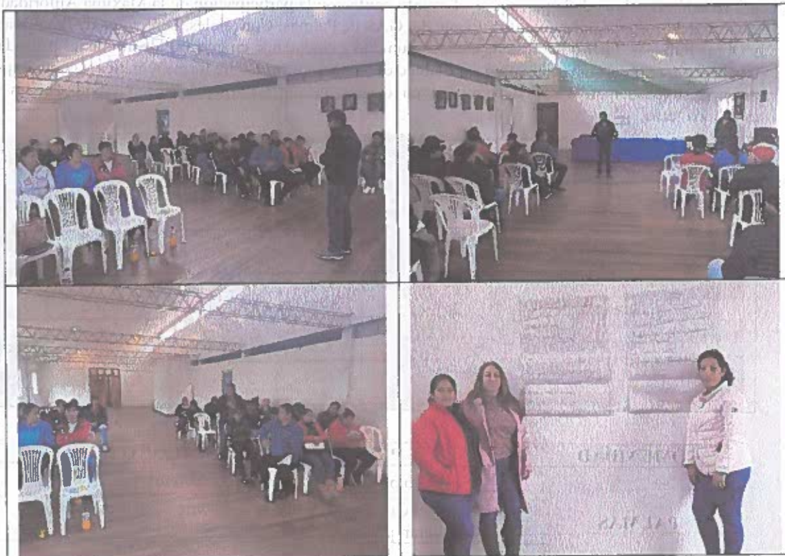
Asistentes a la priorización de obras Amaluza.