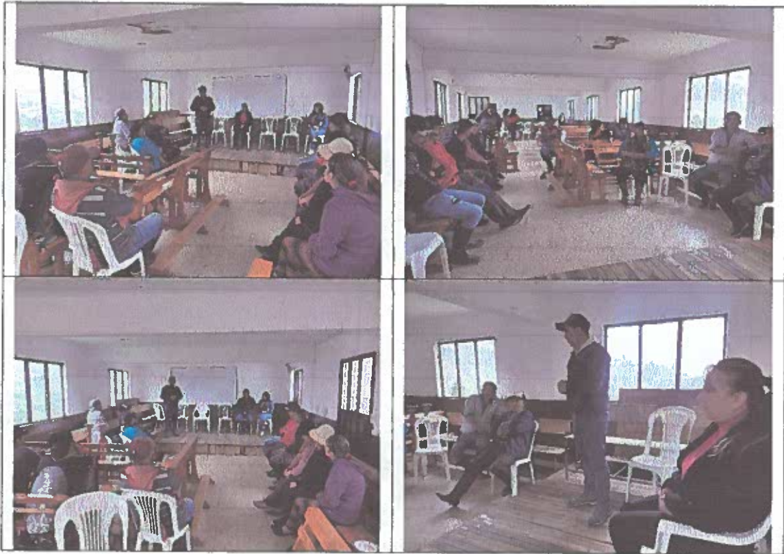
Asistentes a la priorización de obras Chimul.