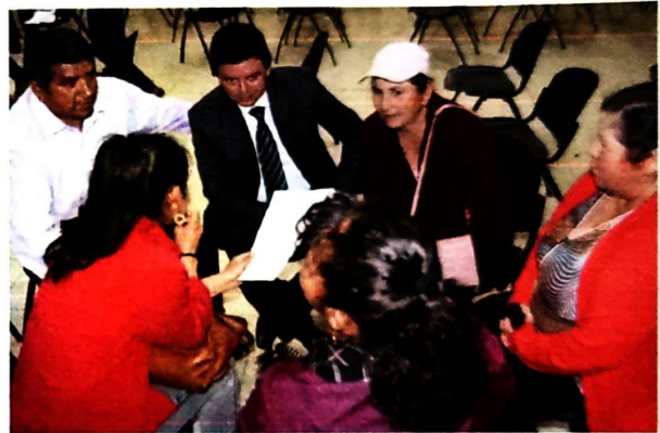
Mesas de Trabajo Rendición de Cuentas 2023.