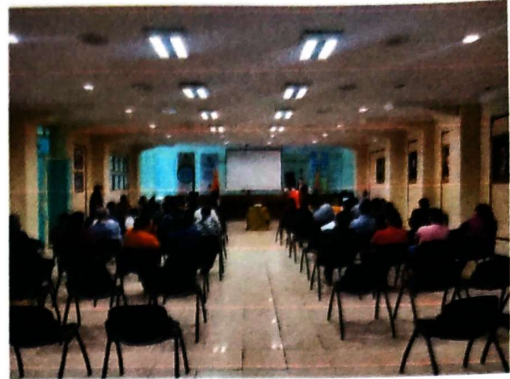
Rendición de Cuentas 2023.